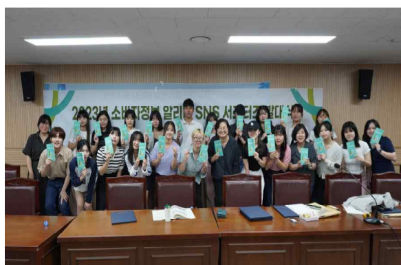
▲ 2023년 소비자정보 알리미 SNS 서포터즈 발대식

한편 미래소비자행동은 이번 대학생 서포터즈 모집 외에도 지난 2010년 9월 4일 창립하여 12년째 소비자복지와 지속 가능한 소비를 위한 운동을 펼치고 있다. 지난해 6개 지역지부를 구성하면서 전국 조직으로 성장하였으며 현재 공정거래위원회 등록 소비자단체이며 열두 번째 한국소비자단체협의회 회원단체이다. 소비자에게 필요한 정보·이슈·인문·산업 분야에서 지역적 가치 발굴을 위한 활동을 펼친 바 있다.