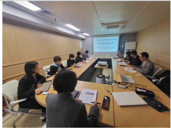
제2차 전문가평가회의 (2023.11.9.)