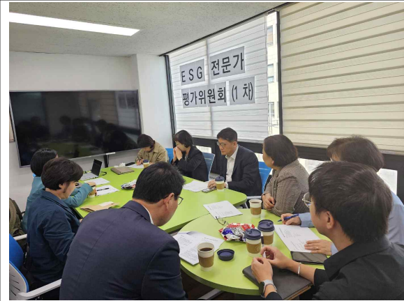
제1차 전문가평가회의 (2023.10.19.)